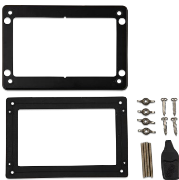
Accesorios incluidos con el GX Touch 50

LED indicador de WiFi El Cerbo GX puede conectarse a una red WiFi