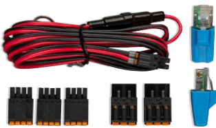
Accesorios incluidos con el Cerbo GX