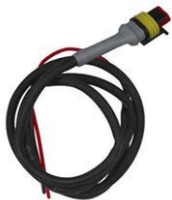
Cable de control para Cyrix-ct 12/24-230 Longitud: 1 m