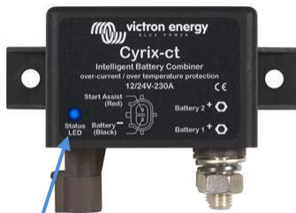
LED indicador de estado