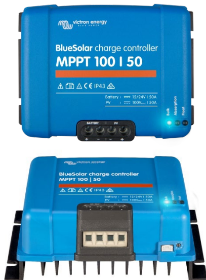
Controlador de carga solar MPPT 100/50